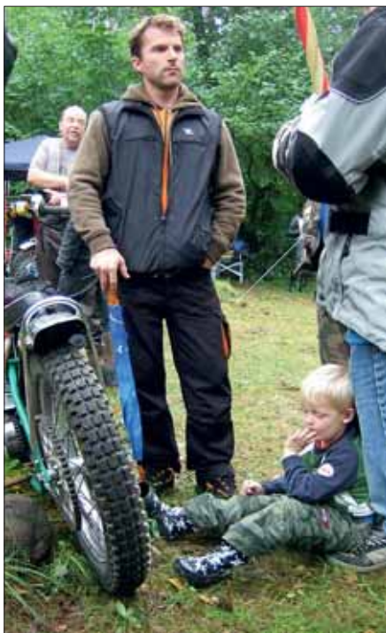
Publik i alla åldrar hade tagit sig upp för backen

Ett drygt trettiotal förare från stora delar av landet hade anmält sig, en del på helt nya eller nygamla hojar. Vårt krav är ju att maskinerna ska vara tidstypiska och gärna se ut som de som en gång deltog i de "riktiga" tävlingarna i backen. Det brukar inte