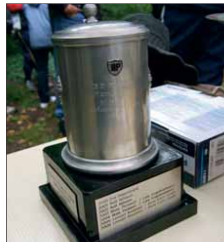
Ett äkta pris från 1930-talets Björns- nästävlingar är nu vårt vandringspris i sidvagnsklassen