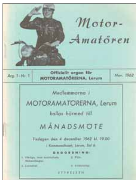
Motoramatörerna Lerums första klubbtidning, från november 1962