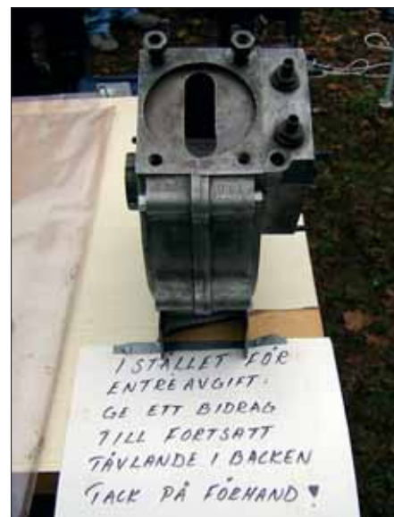
Ett vevhus från en v-twin får tjäna som sparbössa för oss arrangörer