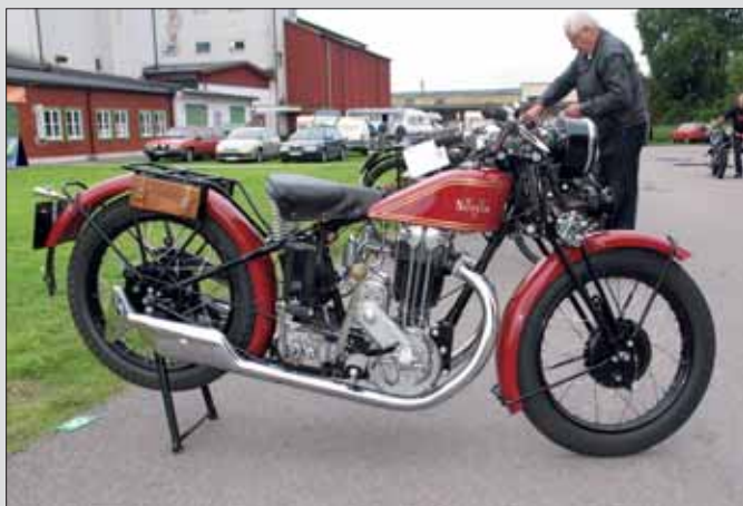
Suecia tillverkad i Örkelljunga 1929