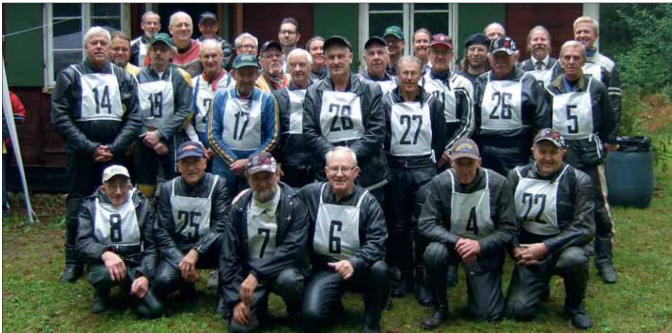
Alla förarna uppradade framför depåstugan