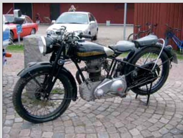
Svecia NSU. Importerad NSU med svenskt varumärke.