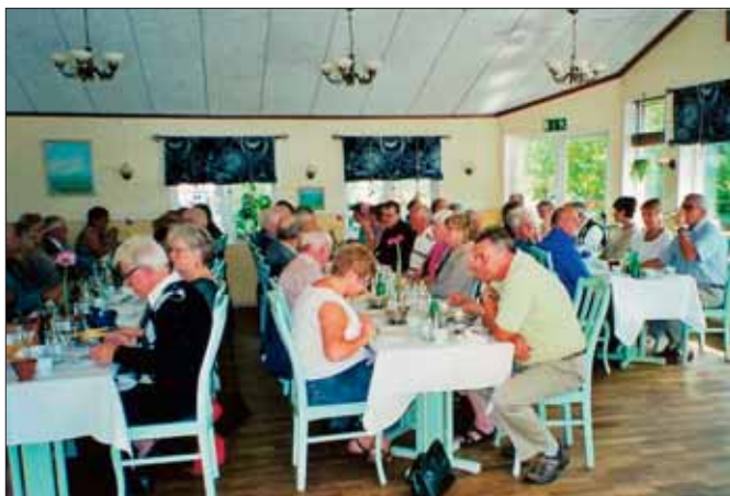
Fullt i matsalen.